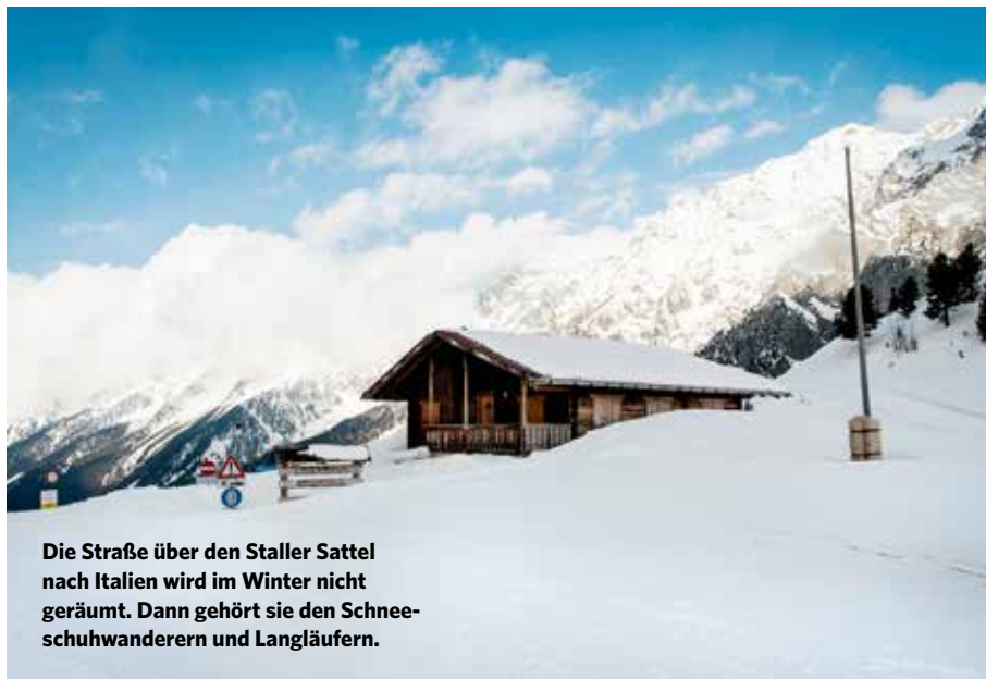
Die Straße über den Staller Sattel nach Italien wird im Winter nicht geräumt. Dann gehört sie den Schneeschuhwanderern und Langläufern.

Im Gegensatz zu den beiden Nachbartälern (dem Virgental im Norden und dem Villgratental im Süden) ist das Defereggental von zwei Seiten mit dem Fahrzeug erreichbar: vom Iseltal in Osttirol und vom Antholzer Tal in Südtirol über den Staller Sattel. Diese enge, kurvige Passstraße ist nur von Mai bis Oktober tagsüber geöffnet und kann Richtung Italien von der 1. bis zur 15. Minute einer Stunde passiert werden, Richtung Österreich von der 30. bis zur 45. Minute. Im Winter wird die Straße vom Defereggental aus nur bis zur Staller Alm geräumt. Von dort führt eine Langlaufloipe bis zum Staller Sattel. In der unberührten Natur mit dem höchsten Gipfel der Gegend, dem Hochgall (3.436 m) in Sichtweite, lassen sich auch herrliche Schneewanderungen und natürlich Skitouren gehen.